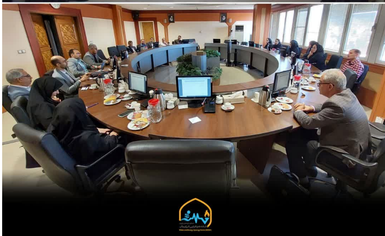
تصویر ۲ یازدهمین "تورتهالی خانه هم‌افزایی انرژی و آب ۷" در این جلسه نظام‌های مدیریتی استقرار یافته در شرکت آب و فاضلاب مشهد و چالش‌ها و نقاط قوت آن ارائه گردید