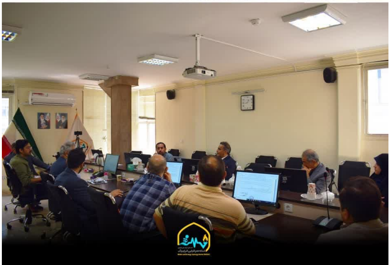
تصویر: ۲ جلسات بررسی شبکه مسائل و چالش‌های صنعت برق کشور ذیل کمیته رفع موانع و اجرای بهینه پروژه‌ها