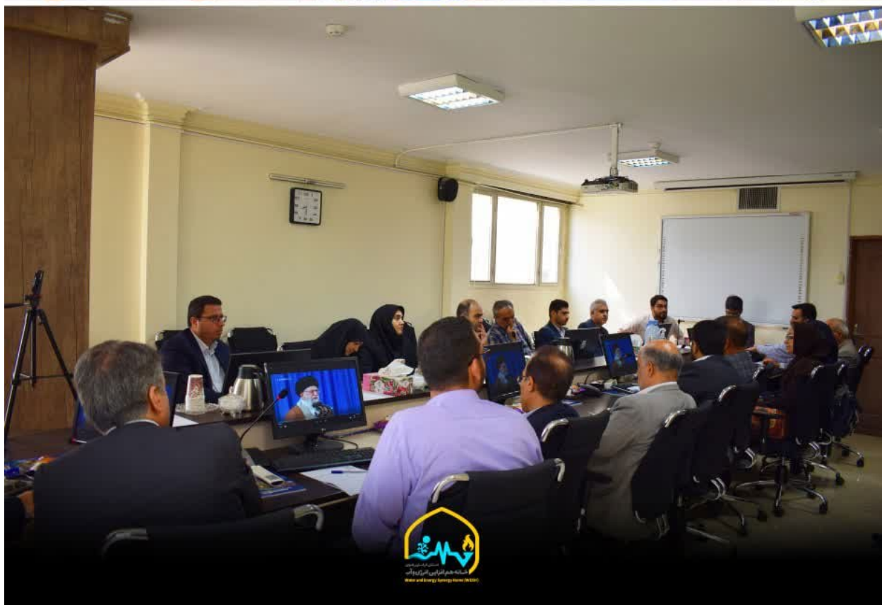
تصویر 4 نخستین جلسه "هم‌افزایی مدیران روابط عمومی و مدیریت مصرف شرکت‌های نفت و نیرو استان