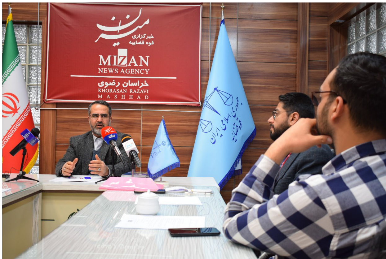
تصویر ۰۸ دیدار با معاون محترم قوه قضائیه و بررسی چالش‌های مرتبط در محورهای انرژی، آب و محیط زیست