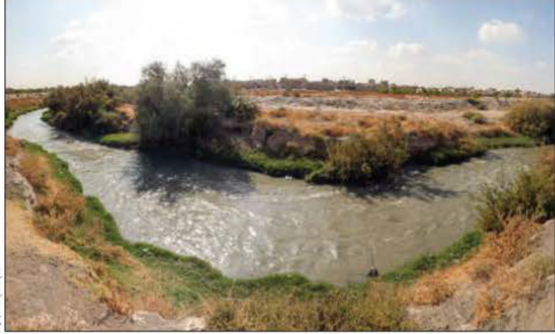
کشف رود در استان کهگیلویه و بویراحمد

با انعقاد توافق‌نامه همکاری بین‌المللی بین کشورهای ایران، پاکستان، هند و چین، هم‌افزایی ملی برای نجات کشف رود آغاز شد. این توافق‌نامه در تهران امضاء شد و بر اساس آن، کشورهای مذکور متعهد شدند تا با همکاری یکدیگر، مشکلات زیست‌محیطی و مدیریت رود کشف رود را حل کنند. این توافق‌نامه به مدت ۱۰ سال اعتبار دارد و شامل برنامه‌های مشترک برای احیای رود و حفاظت از حوضه آبریز آن می‌شود.