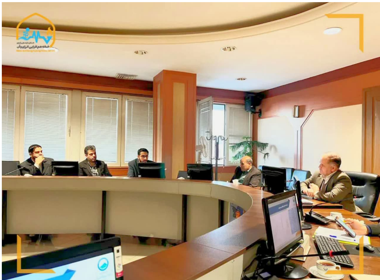
تصویر ۳: جلسات پیگیری برای ایجاد هم‌افزایی برای حل مشکلات کشف رود