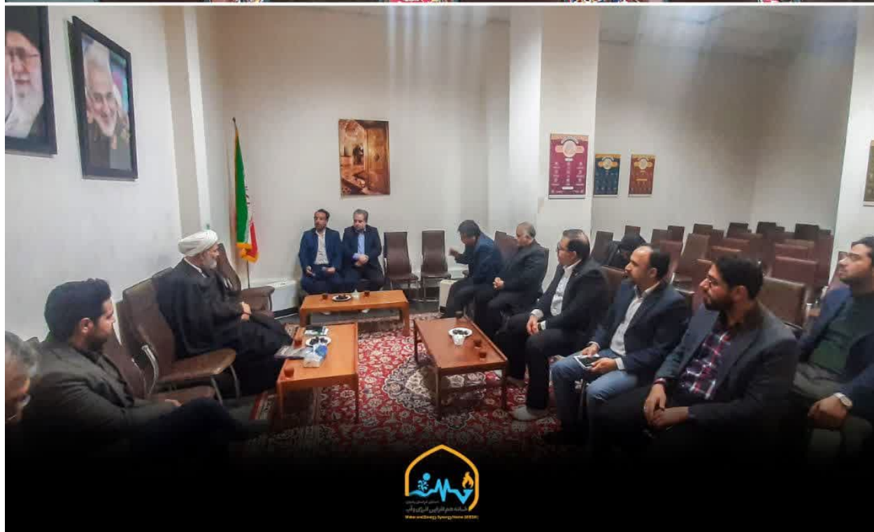
تصویر ۷: دیدار نخبگان و خبرگان عضو سمن خانه هم‌افزایی انرژی و آب استان با «حجت‌الاسلام والمسلمین دکتر پژمانفر» رئیس کمیسیون اصل ۹۰