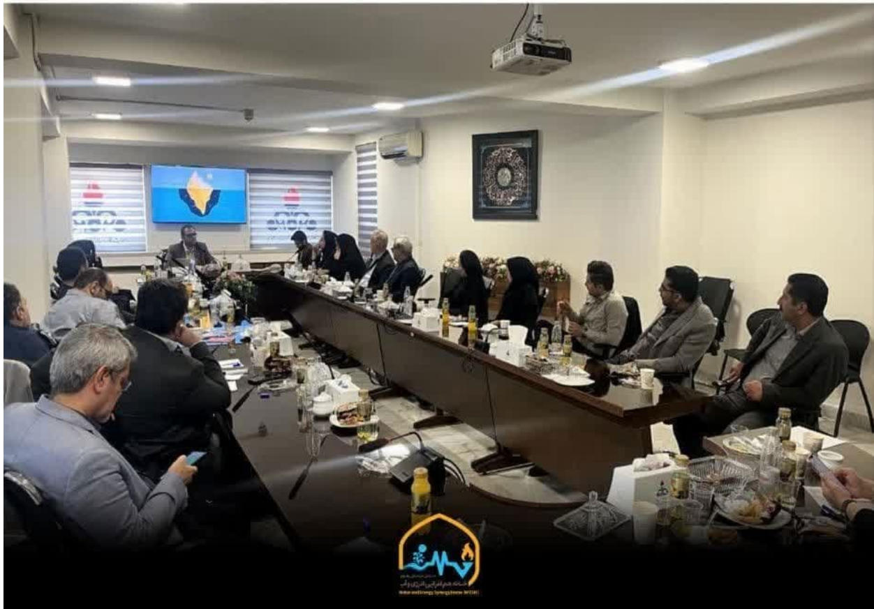
تصویر 1 شانزدهمین #نور تعالی خانه هم‌افزایی انرژی و آب با موضوع «مدیریت دانش» در محل شرکت گاز خراسان رضوی