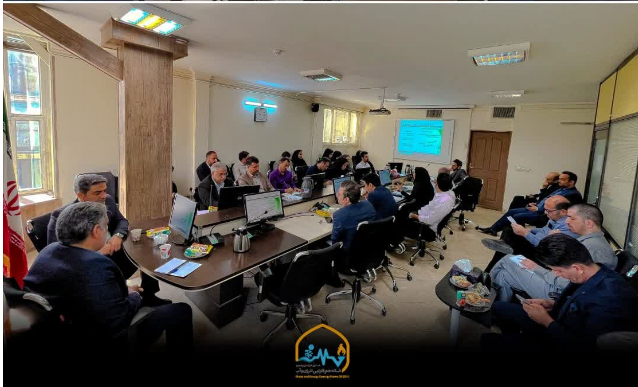
تصویر 3دومین نشست هم‌اندیشی با موضوع «ساختمان‌های سازگار با محیط‌زیست (سبز)» ذیل کمیته آب و محیط‌زیست