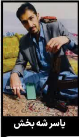
یاسر شه بخش

رهبر معظم انقلاب (مطهره) با تأکید بر اینکه دشمن در محاسبات خود درباره شمال غرب و جنوب شرق کشور دچار اشتباه است، گفتند: من در میان قوم بلوچ زندگی کرده‌ام و آنها عمیقاً به جمهوری اسلامی وفادار هستند. قوم کرد نیز یکی از پیشرفته‌ترین اقوام ایرانی و علاقمند به میهن، اسلام و نظام هستند بنابراین نقشه آنها نخواهد گرفت. رهبر انقلاب اسلامی خاطرنشان کردند: طراحی و اقدامات دشمنان نشان‌دهنده باطن آنها است. همان دشمنی که در اظهارات دیپلماسی می‌گوید ما قصد تهاجم به ایران و تغییر نظام و قصد دشمنی نداریم، چنین باطنی دارد و به دنبال توطئه ایجاد اغتشاش، نابود کردن امنیت کشور و تحریک هیجان کسانی است که ممکن است با برخی هیجان‌ها تحریک شوند.