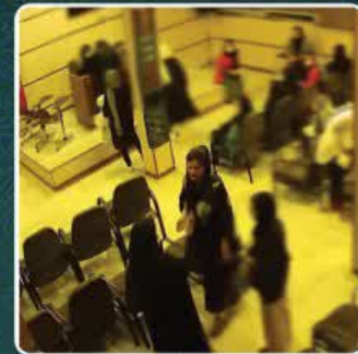
اینم گزارش دوربین های مدار بسته