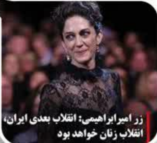
زر امیر ابراهیمی: انقلاب بعدی ایران، انقلاب زنان خواهد بود

زری ابراهیمی بازیگر فیلم موهن عنکبوت مقدس چند ماه قبل در صفحه شخصی خود، خبر از شورش و نا آرامی هایی در آینده نزدیک می دهد که با محوریت زنان برنامه ریزی شده است.