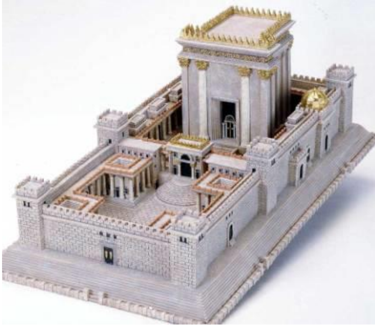
ماکتی از هیکل سلیمان

آن، به تلاش برای ویرانی مسجدالاقصی و مسجدالصخره از طریق حفاری‌ها و ایجاد تونل‌های زیر آن پردازند.