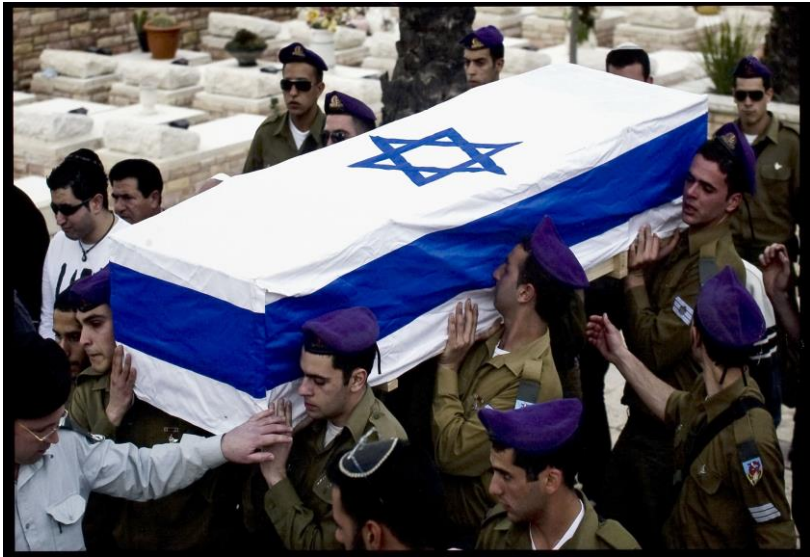
شکست سنگین اسرائیل در جنگ ۳۳ روزه