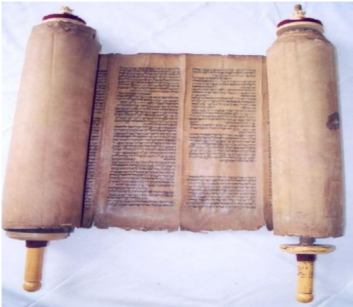
تصویر نسخه‌های قدیمی از تورات

تا اینکه کورش، پادشاه پارس، بر تخت سلطنت تکیه زد و پس از فتح بابل، اسرای بنی اسرائیل را که تا آن زمان تحت نظر بودند، آزاد کرد و «عزرا»ی کاهن را که از مقربین درگاهش بود، رئیس آنها کرد و اجازه داد برای آنها کتاب تورات را بنویسد. عزرا در سال چهارصد و پنجاه و هفت قبل از میلاد مسیح، بنی اسرائیل را به بیت المقدس برگردانید سپس کتب عهد عتیق را برایشان جمع آوری کرد و این همان توراتی است که تا امروز در دست یهود است. ۱