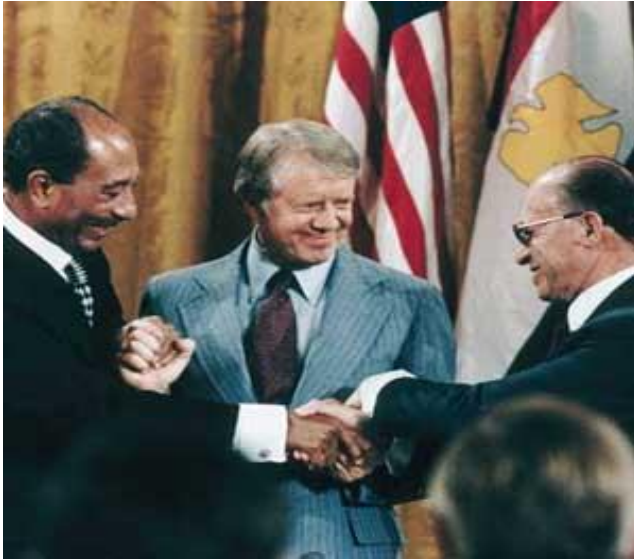
عقد پیمان کمپ دیوید، به ترتیب از سمت راست: مناخیم بگین، جیمی کارتر و انور سادات

بسیار مشکل بود جنگ و خصومت بین دو دشمن قدیمی یعنی اعراب به رهبری مصر و رژیم اشغالگر قدس به پایان رسید و رژیم مصر موجودیت رژیم صهیونیستی را به رسمیت شناخت. این واقعه در آستانه پیروزی انقلاب اسلامی ایران روی داد و باعث ایجاد شکاف بین جهان عرب شد. ۱