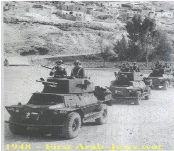
جنگ ۱۹۴۸، اولین جنگ اعراب با اسرائیل